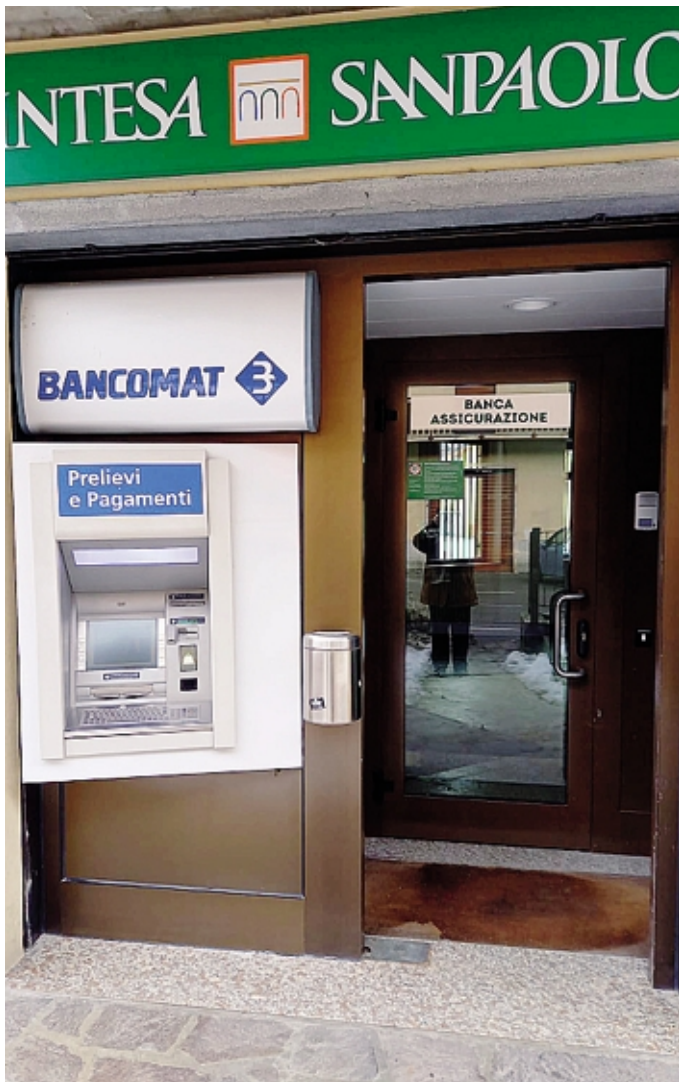
Lo sportello bancomat riaperto a Valbondione.

A nulla erano valsi, prima della chiusura delle due filiali, i tentativi dei sindaci di Gromo, Gandellino, Valbondione e Valgoglio, supportati dall'onorevole Daniele Belotti e da diversi consiglieri dei quattro Comuni, per evitare quanto poi accaduto. Si era comunque riusciti a ottenere, insistendo nel corso di diversi incontri con i rappresentanti della banca, la promessa della riapertura, sia a Valbondione che a Gromo, del bancomat. Ora si è riaperto quello di Valbondione e si spera in una