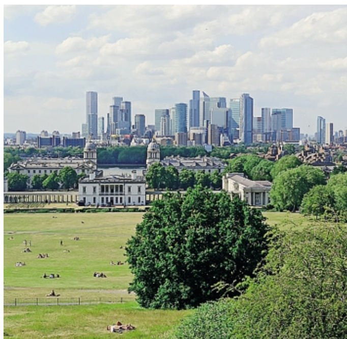
Londra è stata a lungo una delle mete dei bergamaschi emigrati

Nella traiettoria di questi numeri - soprattutto - si coglie un effetto del Decreto Crescita, provvedimento introdotto proprio nel 2019 con sgravi fiscali quinquennali fino al 70% dell'Irpef (o fino al 90% nelle regioni del Sud) per quegli «expat» che sceglievano di rientrare in Italia; un