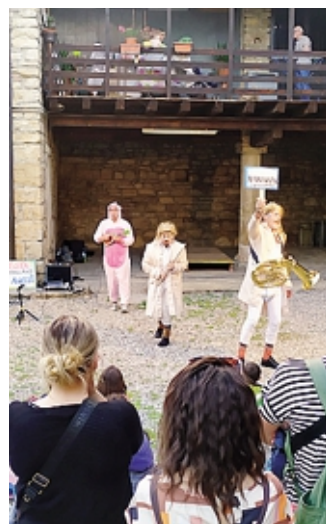
Una delle esibizioni al Festival

Numerosi altri spettacoli di vario genere e tema si sono susseguiti in serata fino alla mezzanotte. Oggi la rassegna riprenderà alle 15.30 e offrirà piacevoli intrattenimenti anche in piazza Nobili Zoppi, all'anfiteatro municipale, in piazza XXV Aprile e al campo sportivo, al cui esterno sono